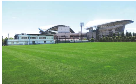
▲埼玉スタジアム 第2グラウンド

サッカー好きな子どもたちに、本物のサッカーグラウンドでゲームを体験して、楽しんでもらうイベントです。出場チームには記念品を進呈します。ぜひ、皆様のご応募をお待ちしています!!